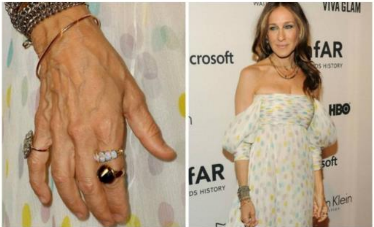
As mãos da atriz Sarah Jessica Parker