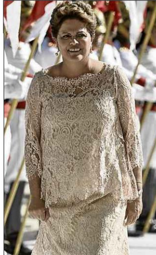
Dilma, um mês antes do período de campanha e na posse em janeiro: 6kg perdidos em apenas 10 dias

ter uma alimentação com carboidratos — e mais calorias —, porém, de forma equilibrada. Nessa fase, o deputado federal afirma ter escorregado na dieta e ganhado peso. Agora, conta ter emagrecido 7kg em 30 dias. "Só comendo potinhos", brincou Vieira Lima.