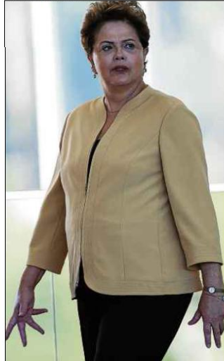
Marcelo Ferreira/CB/D.A Press - 1/1/15